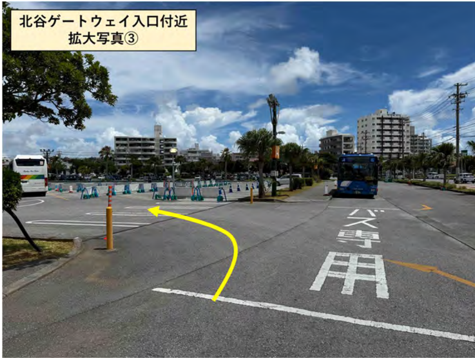
北谷ゲートウェイ入口付近 拡大写真③