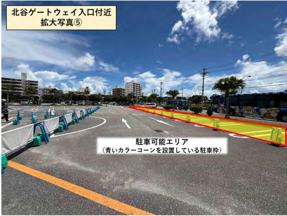
北谷ゲートウェイ入口付近 拡大写真⑤