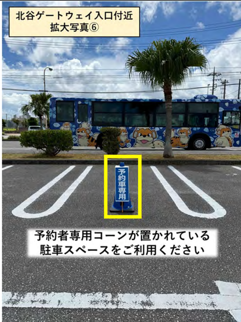
北谷ゲートウェイ入口付近 拡大写真⑥

黄色で示す場所が駐車可能エリアです バス運行の妨げになりますので、上記以外の場所では絶対に駐車しないでください